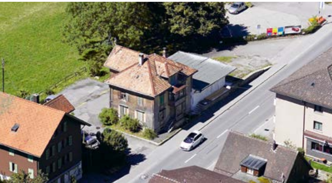
Luftaufnahme des Gebäudes Altes Bahnhöfli an der Morgartenstrasse 4