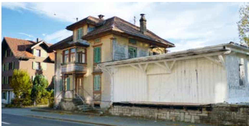
Das alte Stationsgebäude der Strassenbahn Zug–Ägeri

Auf dem Grundstück befindet sich das Gebäude Altes Bahnhöfli, ein ehemaliges Stationsgebäude der Strassenbahn Zug–Ägeri. Falls das Gebäude als Denkmal unter kantonalen Schutz gestellt wird, muss es nach denkmalpflegerischen Grundsätzen saniert werden. Das kantonale Unterschutzstellungsverfahren ist im Gang (Stand bei Redaktionsschluss der Abstimmungsbotschaft). Die Wahrscheinlichkeit einer Unterschutzstellung ist hoch.