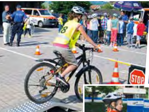
Die Veloprüfung, ein wichtiger Bestandteil der Arbeit ...