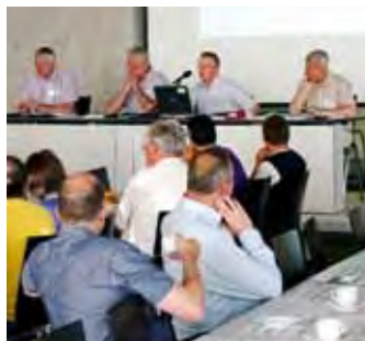
Neuer Schulraum: Die Gemeinderäte informiert.

Nach den einleitenden Voten diskutierten die rund 60 Teilnehmer in Gruppen die 14 Varianten. Zwei Ergebnisse aus allen fünf Gruppen konnte